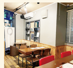
蓮田駅東口より徒歩1分のところにある系列店「カフェ & バーのぶきやーブックカフェ」